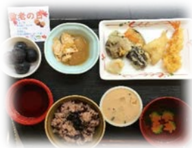
敬老会イベント食