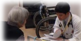
千葉白井病院の往診風景